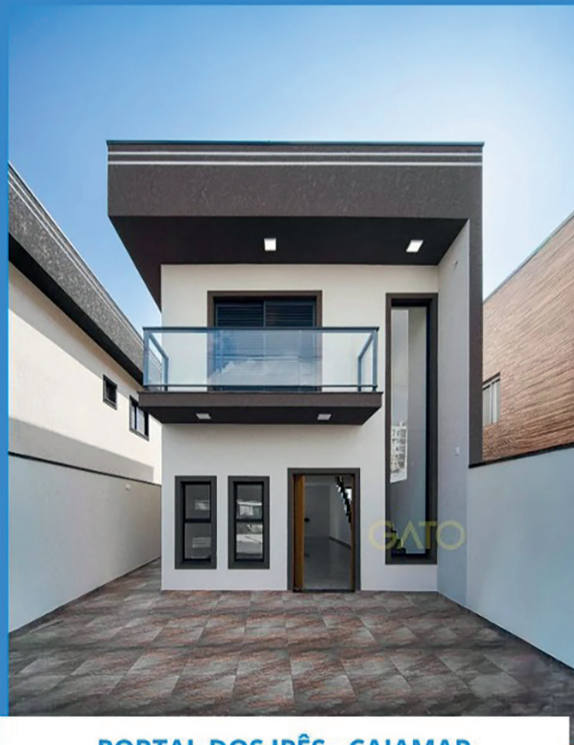
PORTAL DOS IPÊS - CAJAMAR

3 Suite | Sala estar/ jantar | 2 Vagas de garagem Coziha | Área gourmet