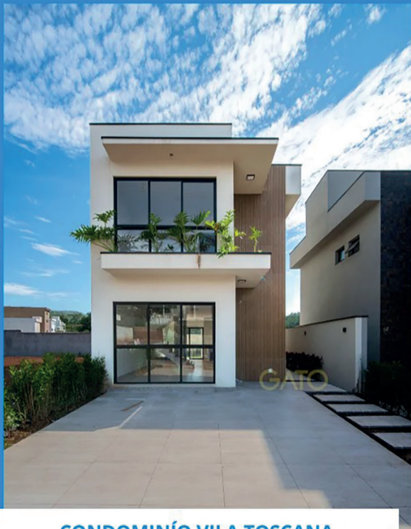
CONDOMÍNIO VILA TOSCANA

3 Dormitórios | Sala estar/ jantar | 2 Vagas de garagem Cozinha | Quintal